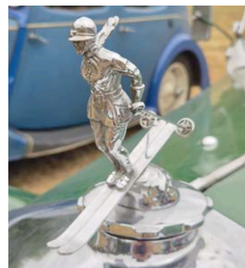
Winter is coming!