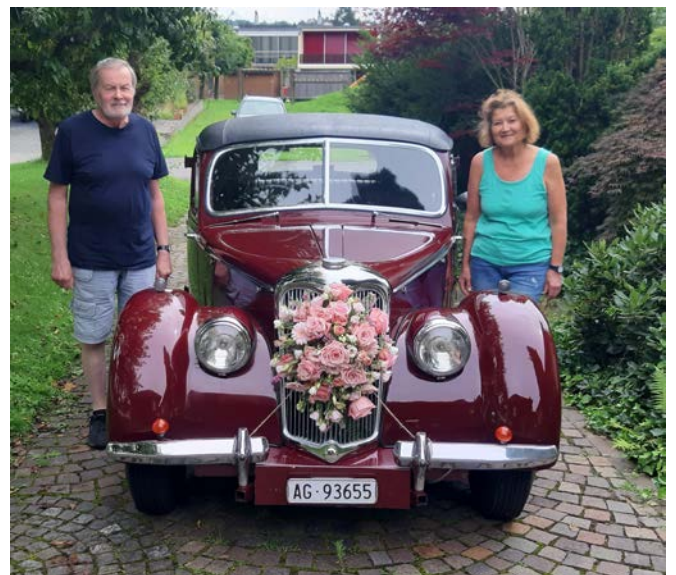
Das herausgeputzte Geburtstagskind und seine stolzen Besitzer

Nicht nur in England wurde dieses Jahr gefeiert, nein auch aus Möriken gibt es ein Jubiläum zu vermelden. Wobei es dieses Mal nicht wie üblich um eine runde Zahl geht, sondern um zwei «Schnapszahlen».