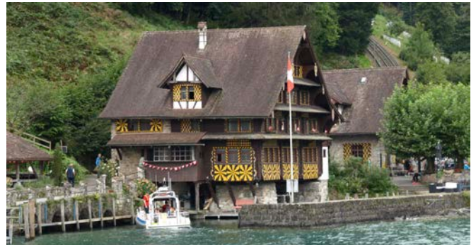
Weekend 2025 (Haus zur Treib)

Ein besonderer Dank gilt deshalb allen, die sich engagiert haben: den Organisatorinnen und Organisatoren unserer Anlässe, den Helfenden im Hintergrund, den Mitgliedern, die mit ihren Ideen, ihrem Fachwissen und ihrer Zeit zum Gelingen unserer Aktivitäten beitragen. Ein Club lebt von Menschen – und euer Einsatz macht den Riley Club Schweiz zu dem, was er ist: eine lebendige Gemeinschaft, in der Leidenschaft und Kameradschaft selbstverständlich sind.