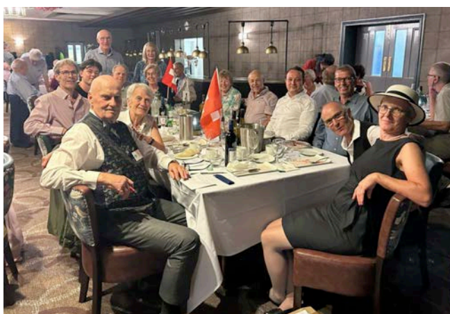
At the Gala Dinner

Nicht nur in England wurde dieses Jahr gefeiert, nein auch aus Möriken gibt es ein Jubiläum zu vermelden. Wobei es dieses Mal nicht wie üblich um eine runde Zahl geht, sondern um zwei «Schnapszahlen».