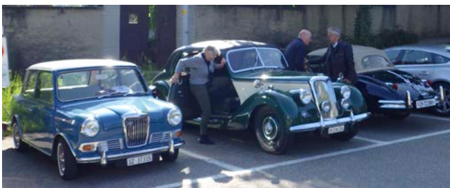
GV in Willisau

wenn die Tage kürzer werden, die Temperaturen sinken und in den Werkstätten wieder etwas mehr Zeit für jene kleinen Projekte bleibt, die während der Fahrsaison liegen geblieben sind, wissen wir: Das Jahr neigt sich dem Ende zu. Für viele von uns beginnt nun die Phase der Rückschau – auf Stunden hinter dem Lenkrad, auf Herausforderungen in der Garage, auf Begegnungen an Ausfahrten und Clubanlässen. 2025 war in vielerlei Hinsicht ein bewegtes Jahr, geprägt von schönen Momenten und einem starken Gemeinschaftsgefühl, das unseren Club seit jeher auszeichnet.