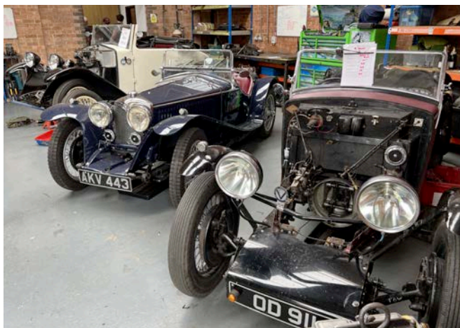
At Blue Diamond