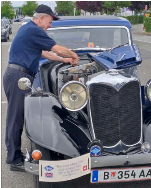
Für einmal gab's was zu schrauben