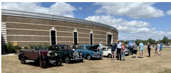
The British Motor Museum Gaydon

Alle Anwesenden dankten den Protagonisten mit einem herzlichen Applaus, dem sich auch der Schreibende gerne anschliesst!