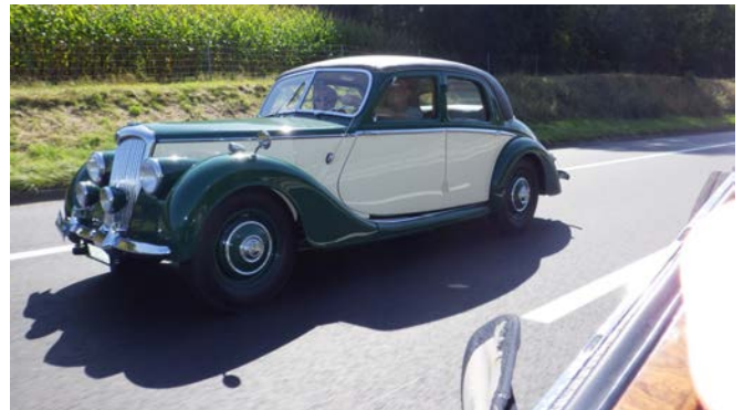
Werner im Top-Speed-Modus

Die Sonne scheint ganz kräftig und es ist jetzt sommerlich warm. Wir umfahren Grenoble und bei der «Aire du Val Gelon» in der Nähe von Chateauneuf (ohne Pape) schalten wir unsere Mittagsrast ein.