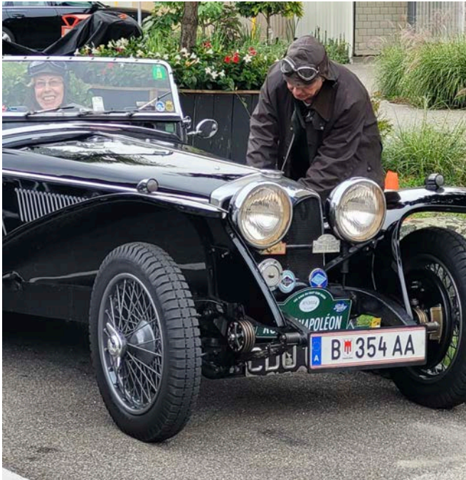
Ready to go