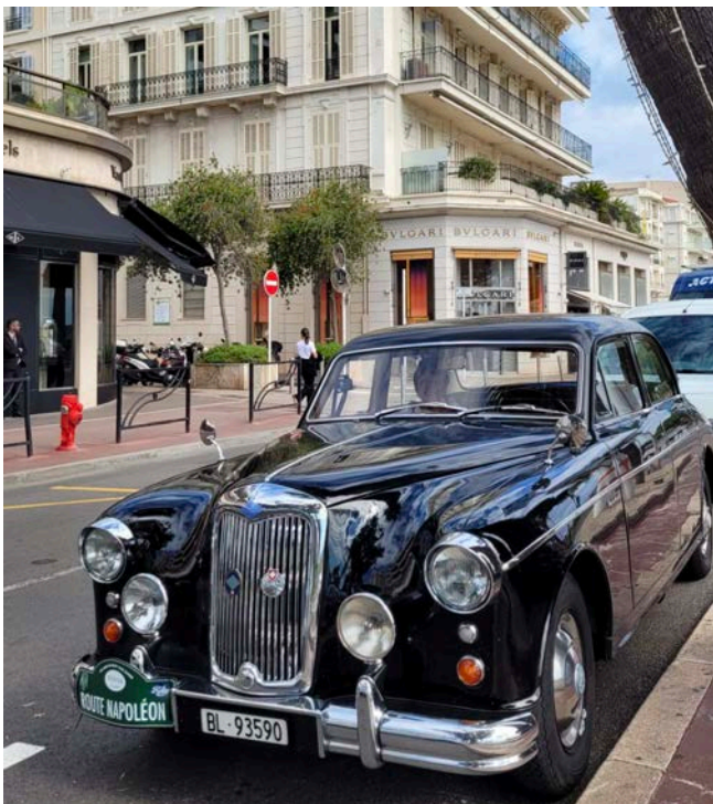
Bella Ella à Cannes

Einige Unentwegte unserer Reise-Gruppe steuern ihre schmucken Boliden der Côte d'Azur entlang und versorgen das WhatsApp-Album mit Bildern ihrer Eindrücke und Erlebnisse.