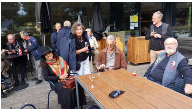
Apéro-Time «Chez Irma»

Von Versoix geht die Fahrt nun weiter über die A41 bis nach Annecy. «Ancor Les Muses» heisst unsere erste Herberge und in der dazu gehörenden «Brasserie Bocuse Irma» erfolgt das erste Debriefing in apéritiver Form. Die weniger wanderlustigen Expeditions-Teile bleiben an Ort und geniessen auch gleich ihr Abendessen bei Irma, während andere sich nach einem Fussmarsch in der Altstadt oder am Seeufer verpflegen.