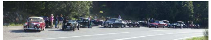
...am Col de Lèques

Die Fahrt geht weiter und bei Dignes-les-Bains biegen wir auf die D900 ein. Hier säumt schwarzes, vulkanisches Gestein die Strassenborde und bildet die Kulisse unserer heutigen Fahrt. In Le Vernet steigen wir im «Moulin» zum Mittagshalt ab, dem ländlichen Lokal mit dem, auf Knopfdruck, singenden Hirschen.