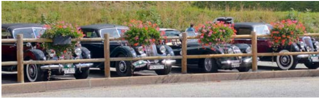
Blumengeschmückte RM's in Corps

Weiter geht es auf der N85, Bonapartes Strasse nach seinem Aufenthalt auf Elba. Gap wird erreicht und ebenfalls umfahren und in Tallard beziehen wir unsere Zimmer im «Boutique Hotel» neben einem schmucken Flugplatz mit brummender Fallschirm-Trainingshalle.