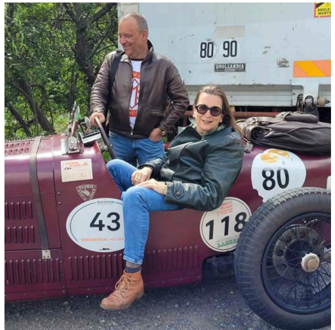
New Club Members?

Die Fahrt geht weiter und bei Dignes-les-Bains biegen wir auf die D900 ein. Hier säumt schwarzes, vulkanisches Gestein die Strassenborde und bildet die Kulisse unserer heutigen Fahrt. In Le Vernet steigen wir im «Moulin» zum Mittagshalt ab, dem ländlichen Lokal mit dem, auf Knopfdruck, singenden Hirschen.