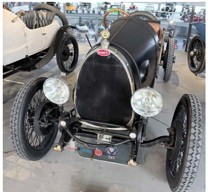
Bugatti Type 13 Brescia (1913 – 1925 493 Expl.)

Nach seiner Anstellung bei De Dietrich folgten weitere Stationen bei Emile Mathis und Deutz AG, Köln, die alle von kurzer Dauer waren, da seine Arbeitgeber mit dem eigensinnigen Bugatti nicht zurechtkamen. Von Deutz erhielt er eine grosszügige Abfindung. Dies ermöglichte ihm am 1. Januar 1910 in Molsheim seine Automobilfabrik zu gründen. Während seiner Zeit bei Deutz entwickelte er im Keller seines Hauses nebenbei seinen ersten Wagen, der als Type 13 im Jahre 1911 auf den Markt kam.