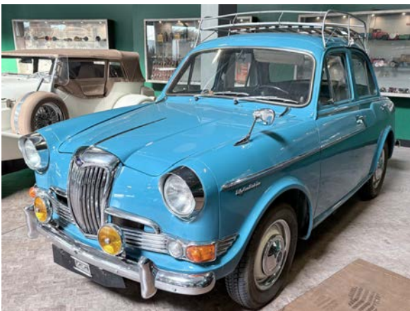
Gesehen im Pantheon Muttenz