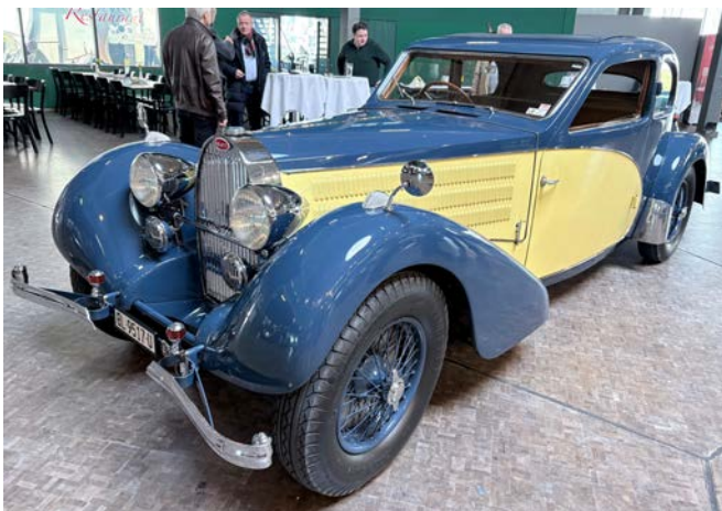
Type 57 C

Der letzte grosse Wurf gelang 1934 mit dem Type 57 (3,3 l, 2 obenliegende Nockenwellen, Type 57 C mit Kompressor). Verschiedene Karosserie-Varianten waren erhältlich.