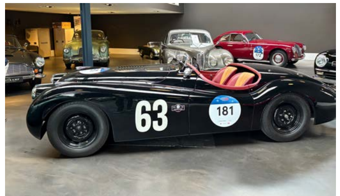
Jaguar XK 120, Maserati, Alfa Romeo