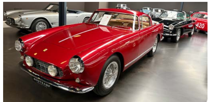
Ferrari 250 GT Boano