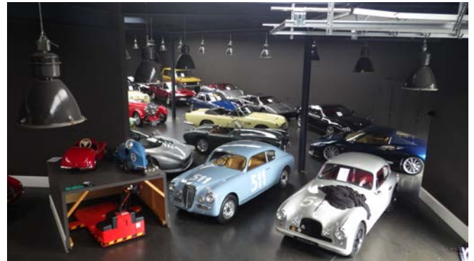
Aston Martin, Lancia, und, und....